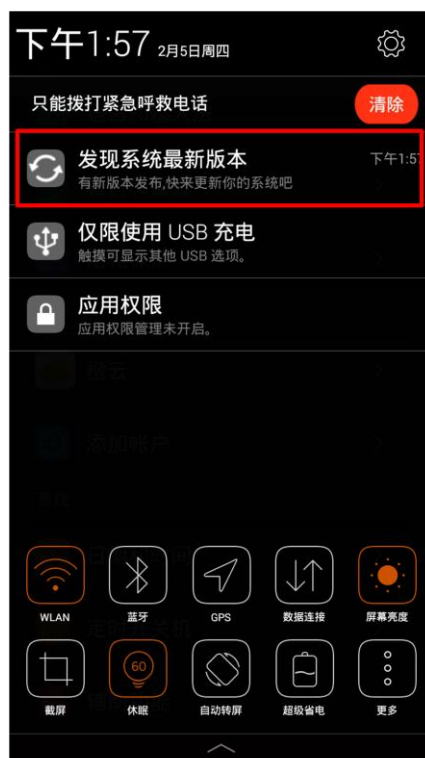
下拉通知栏更新提示