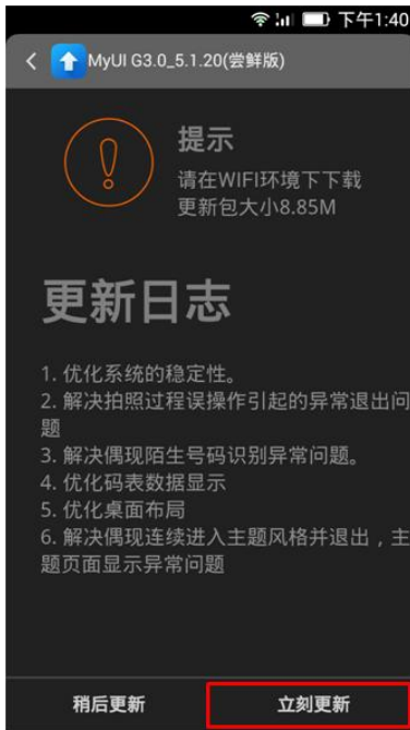
更新版本详情界面