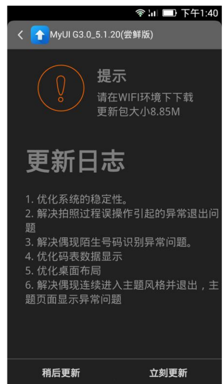
更新版本详情界面